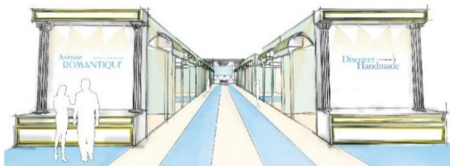
Avenue ROMANTIQUE イメージ

日本ホビーショーは、2020年の東京オリンピックで「ものづくり日本」に注目が集まる今、世界へ向け、ジャパンメイドのハンドメイドの魅力を発信していきます。